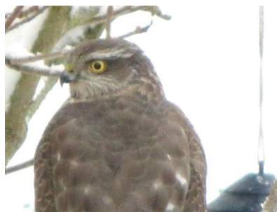
Sparvhök 21/1 2018.

Det var väldigt varierande bilder från när och fjärran, sommar som vinter och på stort och smått. Vissa bilder visade landskapsvyer medan andra var extrema närbilder, några var endast för dokumentation (som det heter när objektet i bild inte visar sig från sin bästa sida) och vissa hade väldigt mycket action. Gemensamt var att det var fint att titta på.