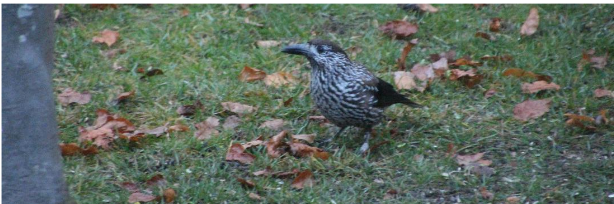
Tjocknäbbad nötkråka på Opalstigen.