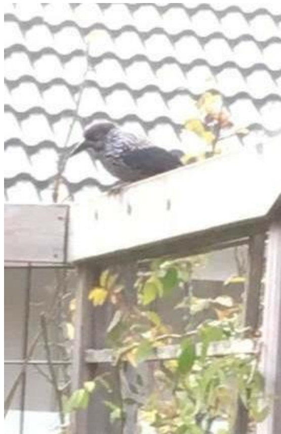
Smalnäbbad nötkråka i Emmaboda 4/11.

Jag gick ner till Olsbosjön. Där var det mer dimma och inget sågs, men en bit bort hördes två kattugglor ropa mot varandra. Vid Skärsjön var det rena mjölken. Här fick jag vänta till halv tio innan man kunde se något. Där fanns bara 3 knipor .