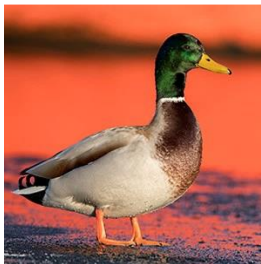
Gräsand var den näst mest rapporterade fågelarten i Artportalen 2018, tätt efter talgoxe. På tredje plats i rapportligan 2018 kom koltrast.

Nu finns 580 000 uppladdade fågelbilder i Artportalen. Under 2018 laddades drygt 60 000 fågelbilder upp, vilket är en minskning från 2017, då antalet var rekordhöga drygt 77 000. Även i andra artgrupper minskade bilduppladdningen 2018 jämfört med 2017. Någon uppenbar förklaring till detta kan inte ses. Tvärt om förbättrades bilduppladdningsfunktionen i Artportalen under 2018, så att processen blev snabbare och enklare.